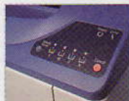
Konica Minolta Magicolor 2500W