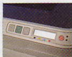
HP Color LaserJet 2600n