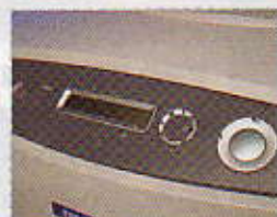
Epson AcuLaser C1100

100 až 90 bodů - ■■■■■, 89 až 75 bodů - ■■■■■, 74 až 60 bodů - ■■■■■, 59 až 45 bodů - ■■■■■, 44 až 20 bodů - ■■■■■, 19 až 0 bodů - ■■■■■ ■ Špičková třída (100-90) ■ Horní třída (89-75) ■ Střední třída (74-45) Všechna hodnocení v bodech (max. 100 bodů)